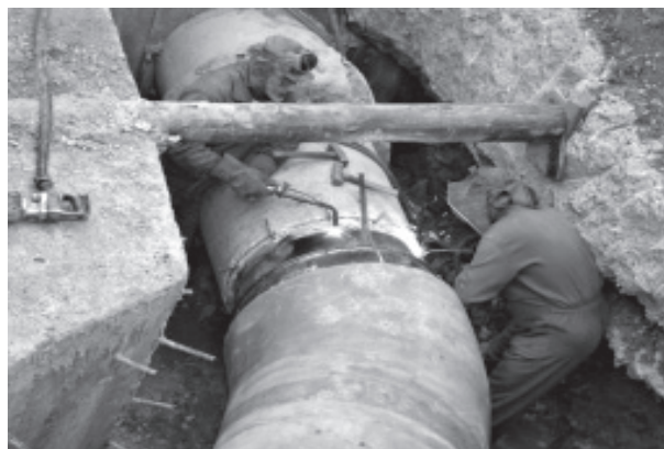
Figura 1. Trabajo en zanjas grandes

La profundidad media aproximada de las zanjas es de tres metros, lo que conlleva colocar la entibación de la misma en función del terreno.