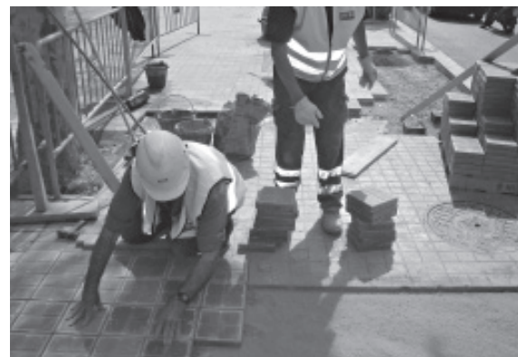
Figura 2. Trabajo en zanjas medianas