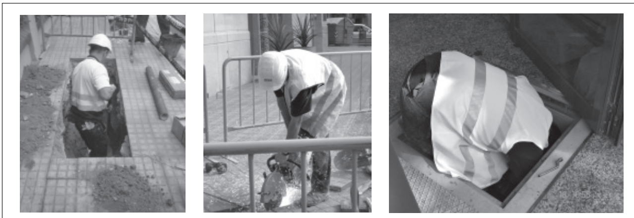
Figura. 3. Trabajo en zanjas pequeñas

La obra se inicia con la apertura manual de catas para localizar los servicios previamente marcados por el responsable de la brigada mediante el localizador.